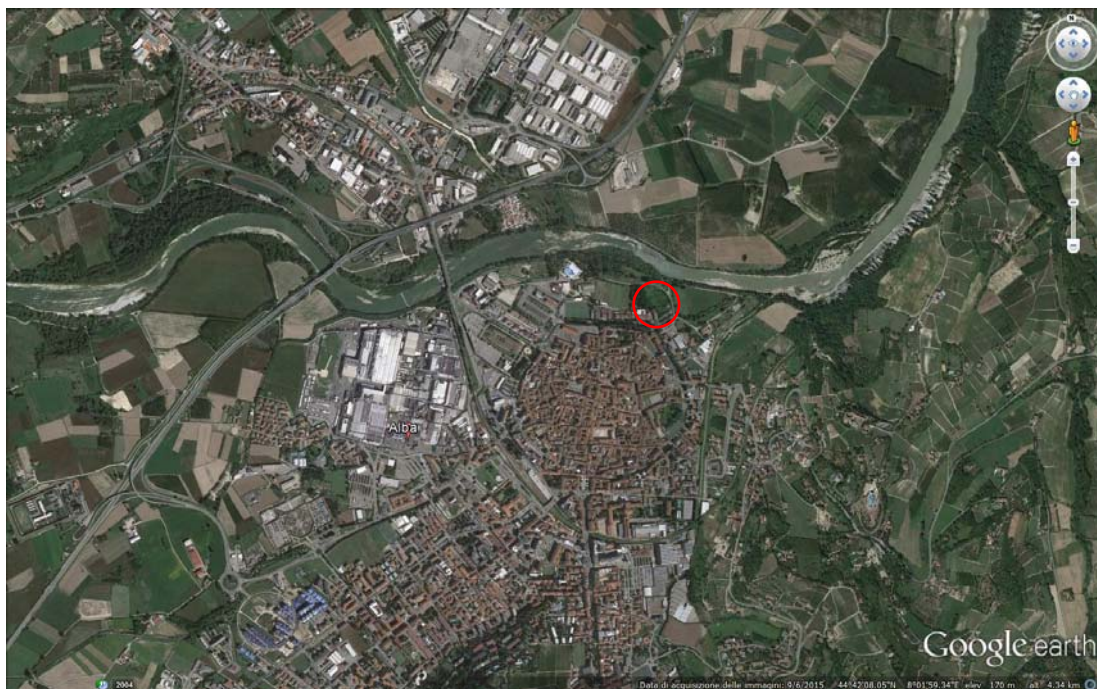
Fig. 2.2. Localizzazione della zona di intervento su foto aerea