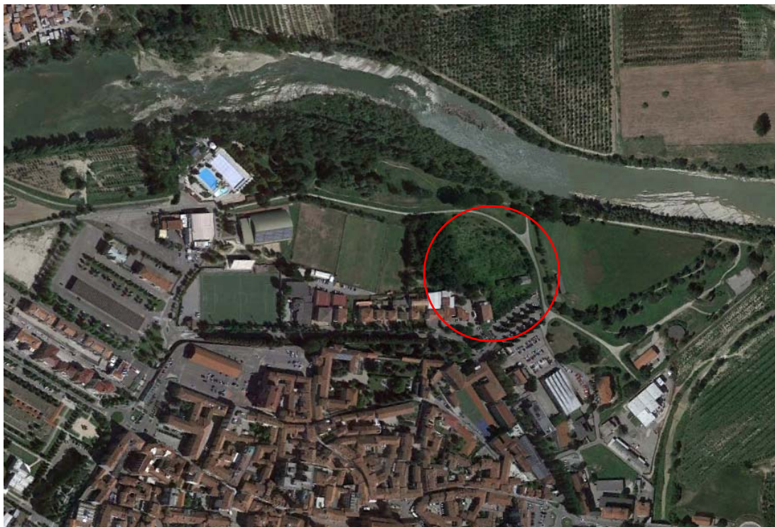
Fig. 2.3. Particolare della zona di intervento su foto aerea